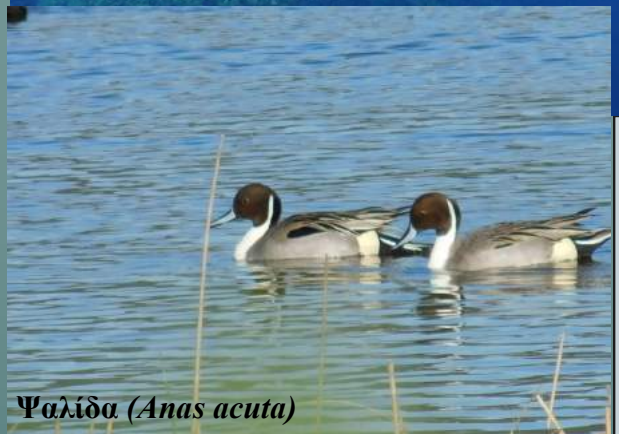
Ψαλίδα ( Anas acuta )