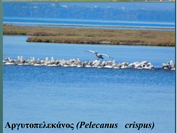
Αργυτοπελεκάνος ( Pelecanus crispus )

ΦΟΡΕΑΣ ΔΙΑΧΕΙΡΙΣΗΣ Καλαμά-Αχέροντα-Κέρκυρας