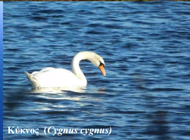
Κόκνος ( Cygnus cygnus )