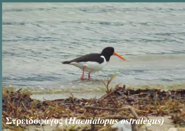
Στρειδοφάγος ( Haematopus ostralegus )